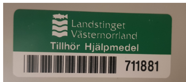
Exempel Hjälpmedel Västernorrlands märkning