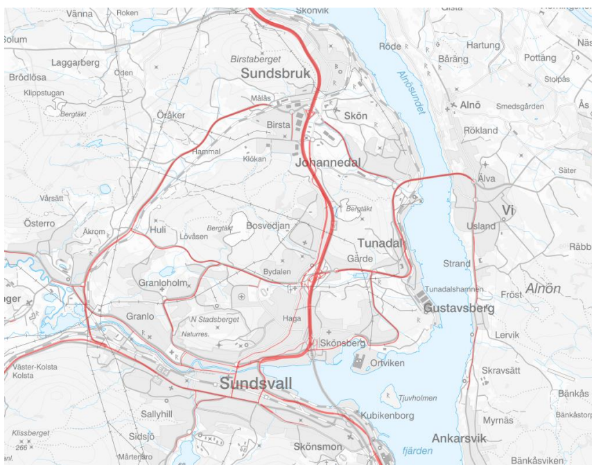
Karta över vägar där den ekvivalenta ljudnivån överstiger 65 dBA

Bullernivåer bestäms lämpligast genom beräkningar då det ger mer tillförlitliga värden än mätningar.