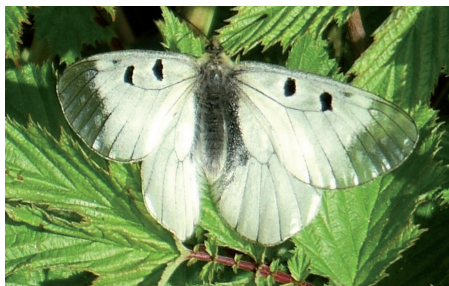
Mnemosynefjäril, Medelpads landskapsfjäril

Stor chans att se mnemosynefjäril, Medelpads landskapsfjäril, men även många andra fjärilar. Gillar man gräshoppor och vårtbitare är ängsmarker oftast värda ett besök. Även fågellivet är rikt kring ängsmarker som betas. Kring Smedsgården kan man få se enstaka rovfåglar,