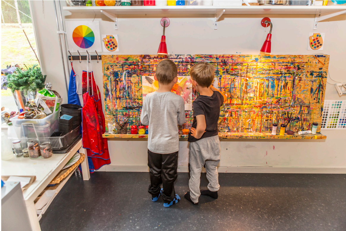
Ateljén ska inspirera till kreativitet och skapande. Den ska ligga centralt och vara enkel att nå från hemvistet.