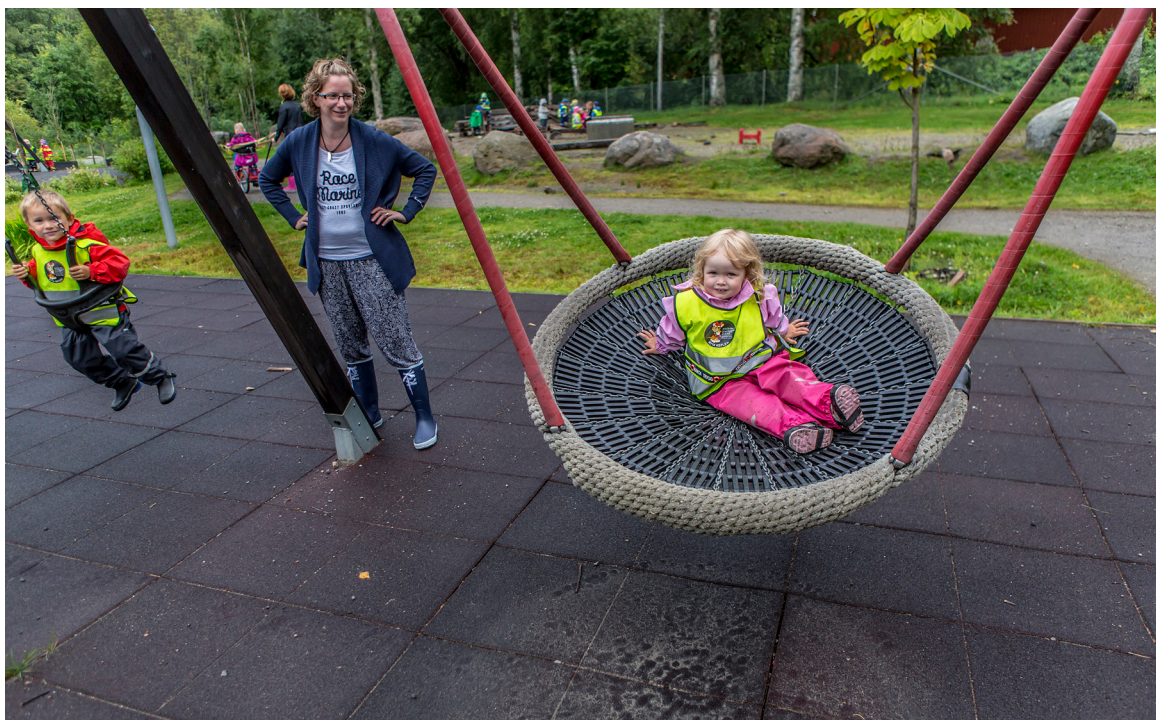
Barn ska ha tillräckligt med friyta för lek och utevistelse. Gården ska bjuda in till utevistelse, främjarkreativitet och fysisk aktivitet.

Barnen ska ha tillräckligt stor friyta som är lämplig för lek och utevistelse. Det finns inget absolut krav på storlek. Det viktiga är den totala bedömningen av tomten tillsammans med de för området specifika förutsättningarna. Förskolegårdens storlek kan därmed variera, men 35 kvadratmeter per barn och en total samlad yta på cirka 3 000 kvadratmeter bör eftersträvas. Dock ska det alltid tas hänsyn till den omedelbara närheten, ligger det till exempel en park bredvid förskolan kan förskolans ytor minskas.